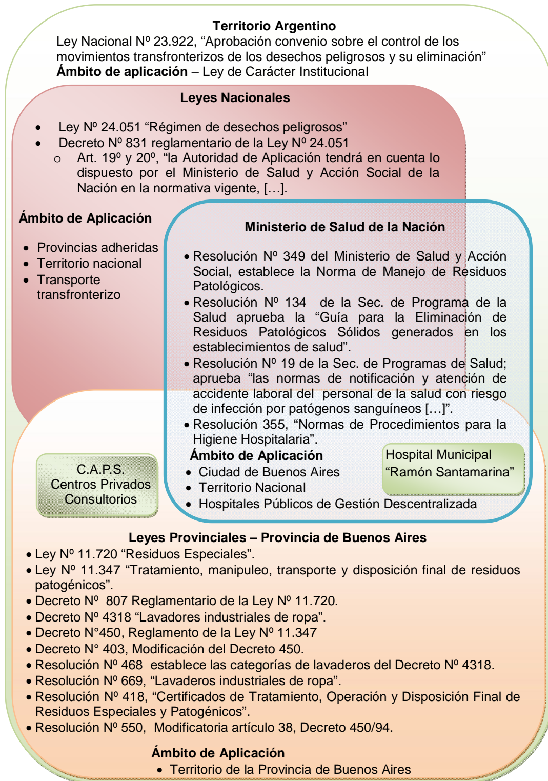
Figura 1. Legislación aplicable a RES.